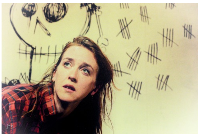
« Bye Bye Blondie » © Spark Cie

En parallèle, la Spark, en collaboration avec Commédiamuse, dirige et coordonne un projet culturel et artistique « culture et handicap » pour des publics en difficulté (25 élèves de l'ITEP, de l'IME et du CFT) à l'IDEFHI de Canteleu (140h). Projet subventionné par l'ARS, la DRAC Haute-Normandie et avec deux mécènes : Fererro et la Caisse d'Épargne.