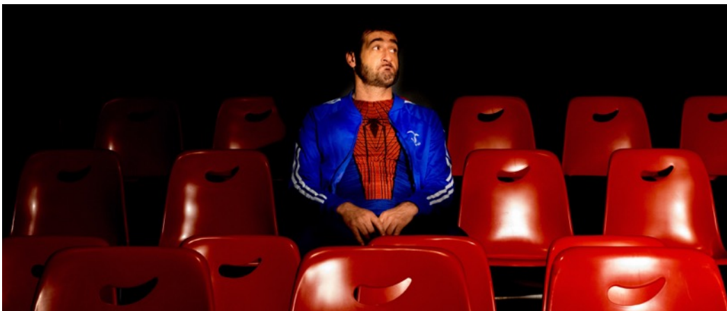
«L'héroïsme au temps de la grippe aviaire »